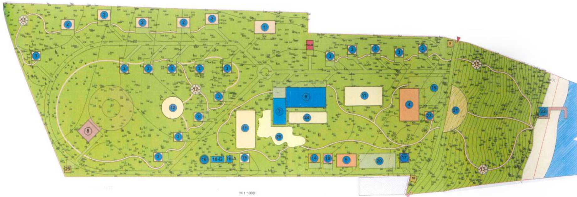
Схема генплана с эскизом застройки