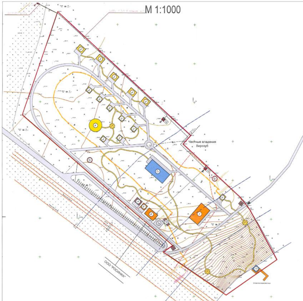
Схема планировочной организации земельного участка