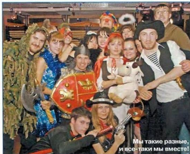
Мы такие разные, и все-таки мы вместе!