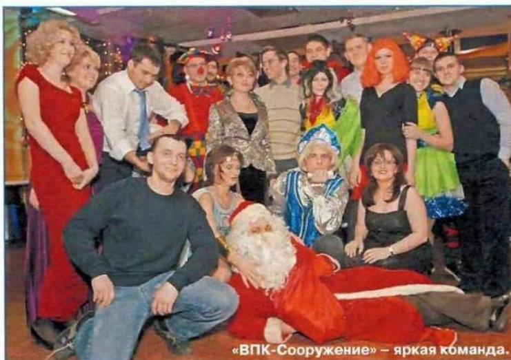
«ВПК-Сооружение» – яркая команда.