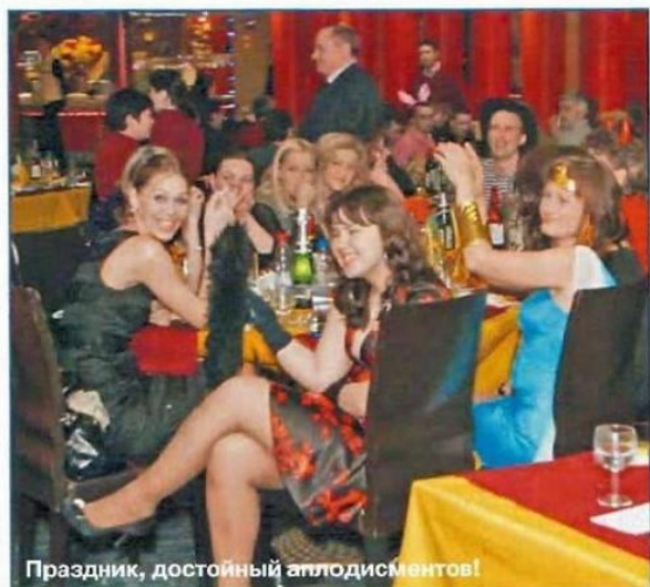
Праздник, достойный аплодисментов!